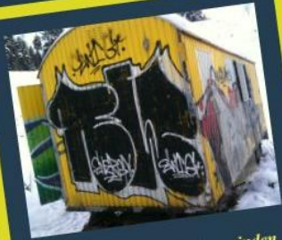
wie werden wir in den Gemeinden bekannt?