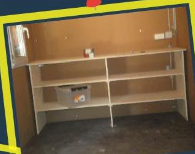
Austausch mit Fachstellen